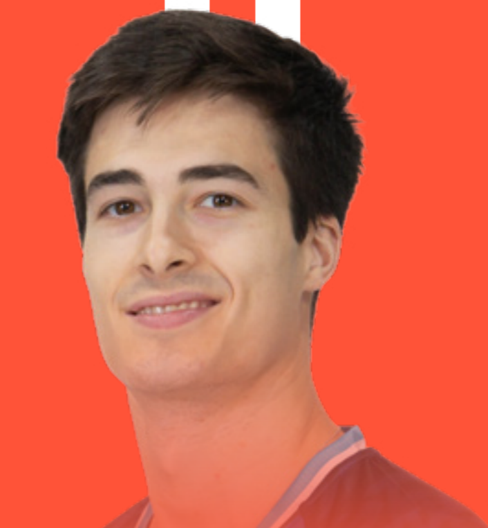
EDU CALLE ARRIÈRE GAUCHE