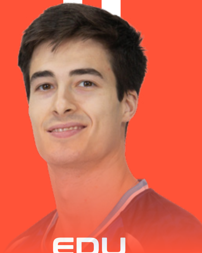
EDU CALLE ARRIÈRE GAUCHE